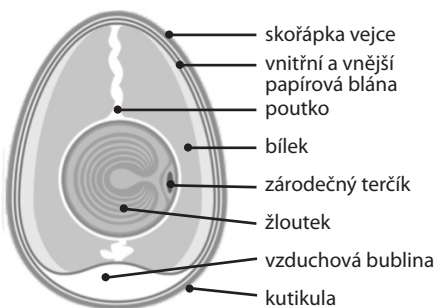
Obrázek: Podrobný popis vejce v podélném řezu

Velikost vajec se vyjadřuje jejich hmotností, ta je velmi proměnlivá, kolísá mezi 30 až 85 gramy. Průměrné vejce váží 58 až 62 gramů. Žloutek tvoří 30 % hmotnosti, bílek 60 % a skořápka 10 %. Barva skořápky je buď bílá, nebo hnědá, to je dáno plemenem nosnice.